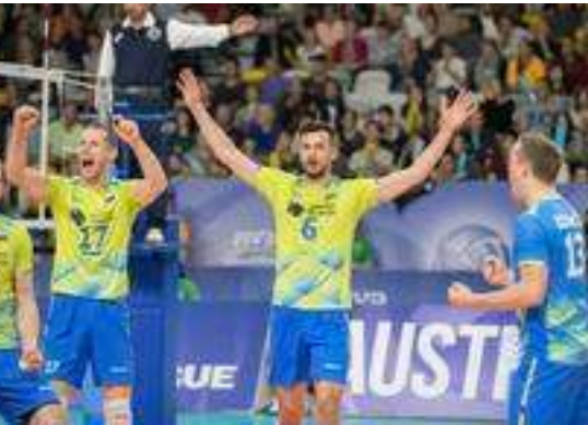
Evropsko prvenstvo na Poljskem so naši odbojkarji zaključili na 8. mestu.