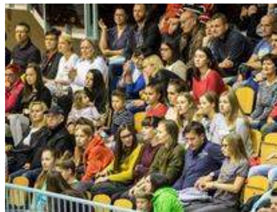
Tekme rednega dela prvenstva v 1. DOL je spremljalo 26.255 gledalcev.

ACH Volley Ljubljana in Calcit Volleyball sta poskrbela za izjemen boj za naslov državnih prvakov. Ljubljančani so lovili trinajsti zaporedni naslov, Kamničani so zadnjega osvojili v sezoni 2002/03. Po štirih odigranih srečanjih je sledil še odločilni, peti obračun. V Hali Tivoli se je zbralo skoraj 3000 ljubiteljev odbojke.