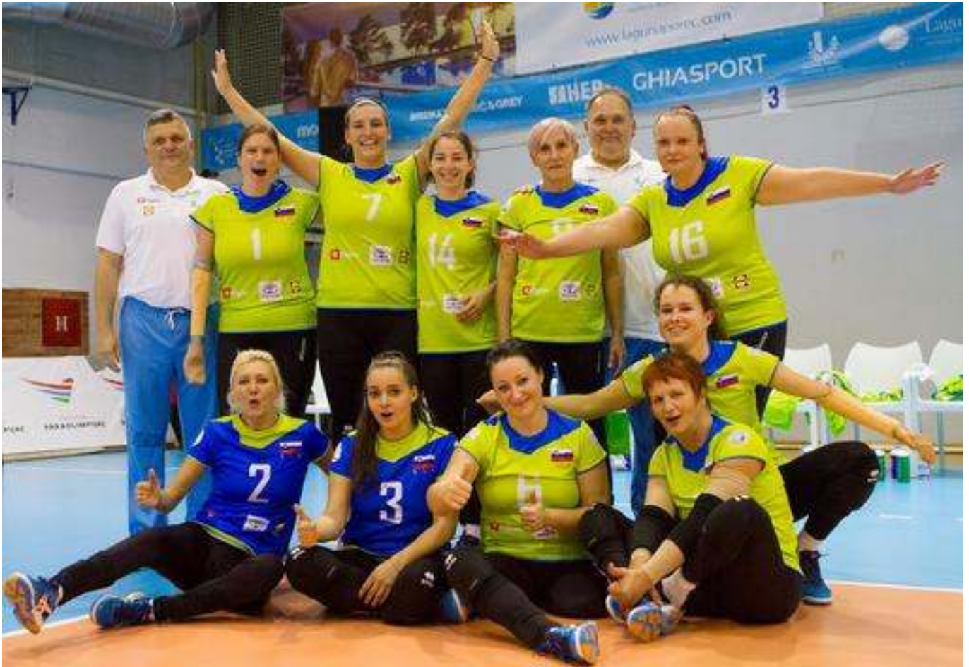
Odbojkarice so si na evropskem prvenstvu v Poreču priigrale 5. mesto.