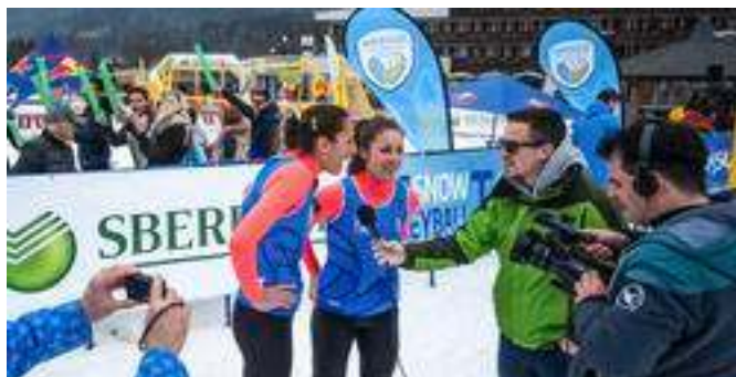
FOTO UTRINKI S SNEŽNE PLAŽE V KRANJSKI GORI