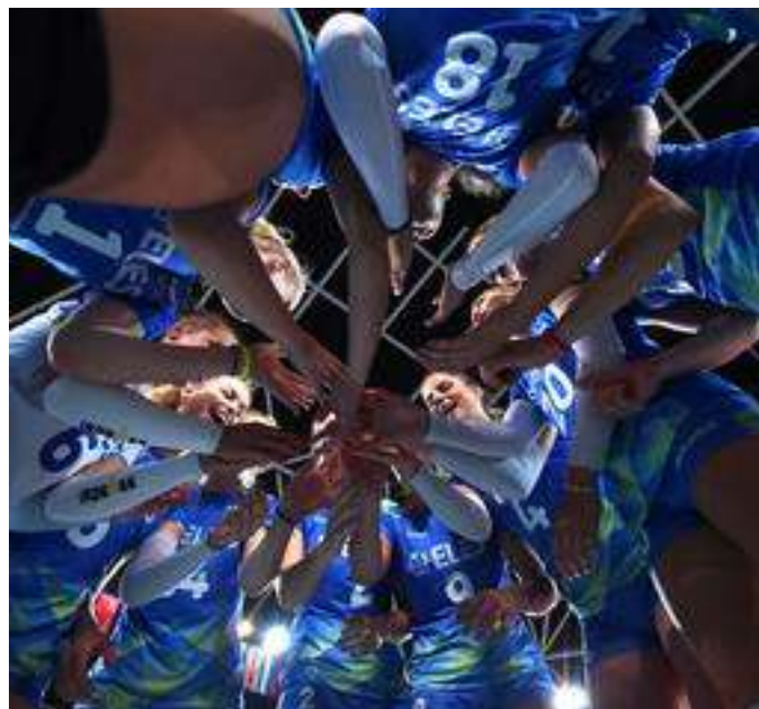
KOLAJNA ZA SLOVO SREBRNE GENERACIJE