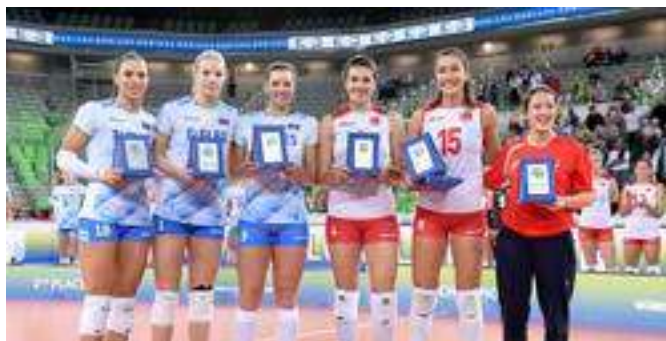
TRI SLOVENKE MED NAJBOLJŠIMI POSAMEZNICAMI PRVENSTVA