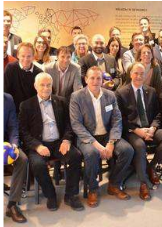
Prvi sestanek organizatorjev evropskega prvenstva za moške 2019.

"Letvico vsako leto postavimo višje in povečamo prihodke, a bomo morali raven očitno še naprej zviševati, saj se vedno znova izkaže, da bi sredstev potrebovali še več."